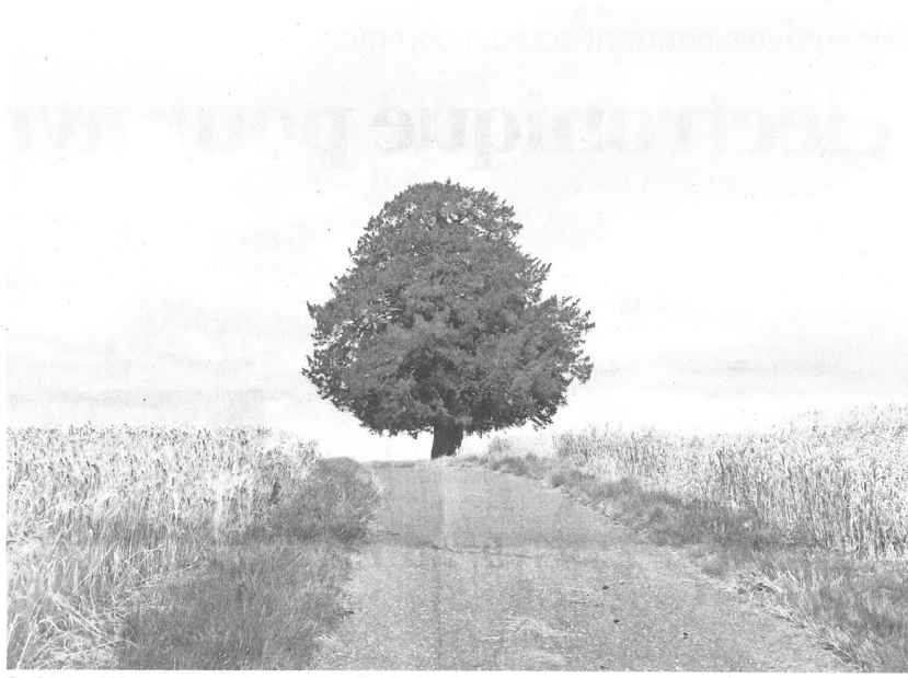
Cet if, âgé de 500 ans, se trouve à Ueberstorf. Il est l'un des 21 arbres spectaculaires du canton recensés par le SFN. Julien Chavallaz

Pourtant, faire partie de la liste des arbres spectaculaires ne protège pas contre la coupe. «Le but de ce cadastre n'est pas de créer une restriction particulière. Cette démarche est plutôt